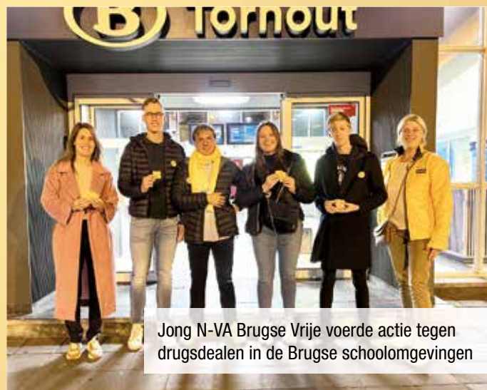
Jong N-VA Brugse Vrije voerde actie tegen drugsdealen in de Brugse schoolomgevingen

Jongeren lijken op steeds jongere leeftijd in aanraking te komen met drugs. “Onze scholen zijn een belangrijke schakel in het preventie- en repressiebeleid rond drugs bij jongeren. Daarom vragen wij de scholen in Brugge en omstreken een beleidsmatige aanpak op lange termijn. Daarnaast pleiten we voor een goeie dialoog tussen de schooldirecties en politiezones om indien nodig repressieve maatregelen te nemen”, stelt Jong N-VA Brugse Vrije.