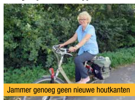
Jammer genoeg geen nieuwe houtkanten

daarvoor een tweede oproep gelanceerd wordt, waardoor de kans groot is dat Jabbeke de boot en de subsidie zal missen. Het is geen evidentie in onze gemeente om vanuit de oppositie een voorstel goedgekeurd te krijgen. Gewoonlijk worden onze voorstellen weggestemd. Nu wordt een goedgekeurd voorstel zelfs niet eens uitgevoerd. Dat getuigt van een slecht bestuur en weinig respect voor de oppositie.