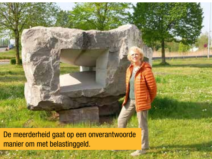
De meerderheid gaat op een onverantwoorde manier om met belastinggeld.